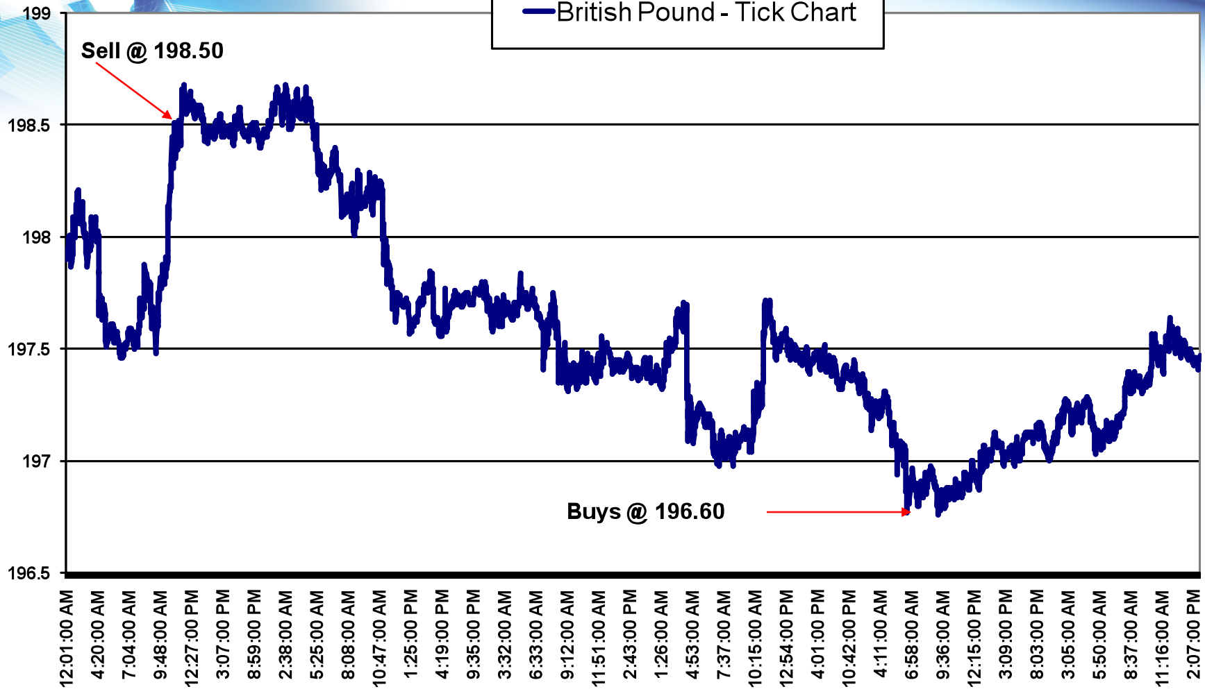
— British Pound - Tick Chart